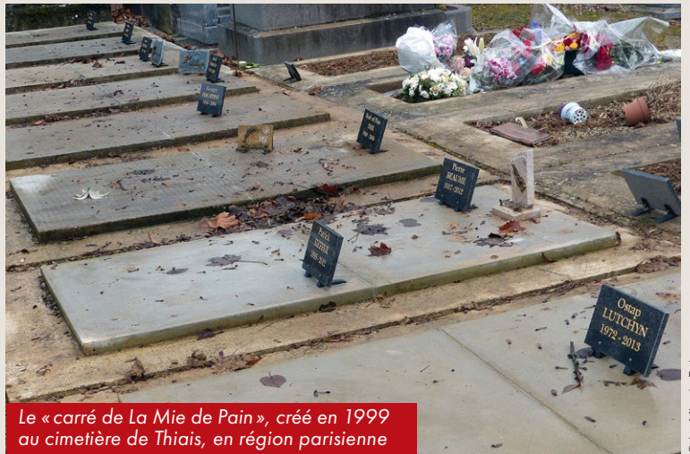
Le « carré de La Mie de Pain », créé en 1999 au cimetière de Thiais, en région parisienne

Une cérémonie annuelle est également organisée chaque année en novembre, en hommage à toutes les personnes enterrées au « carré de La Mie de Pain ».