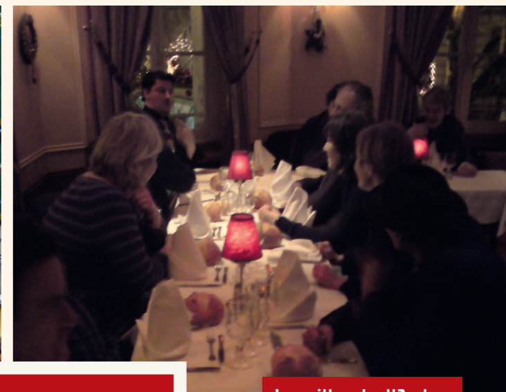
La villa de l'Aube

Comme chaque année, le centre d'hébergement le Refuge est en effervescence. Bénévoles et salariés, hébergés, partenaires, donateurs... Tous se mobilisent pour organiser un grand réveillon ouvert à tous les bénéficiaires : les personnes hébergées, mais aussi celles qui sont accueillies pour les repas du soir. Au programme : dîner de fête, animation musicale et cadeau utile remis à chaque convive. Grâce à votre générosité, plus de 520 personnes avaient bénéficié l'an dernier d'un tel réveillon solidaire.