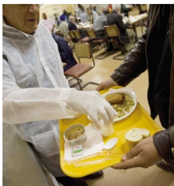
Distribution de repas au centre d'hébergement d'urgence

Jusqu'à présent, le Refuge ouvrait ses portes à 17h pour proposer aux sans-abri un repas chaud, un hébergement, plus si nécessaire de premiers soins médicaux. Mais les personnes hébergées devaient retourner à la rue chaque matin à 8h30, après le petit déjeuner, sans savoir où aller. Il n'était pas rare de voir certains se presser devant le centre plusieurs heures avant la réouverture des portes.