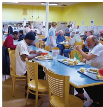
Repas des accueillis au centre d'hébergement d'urgence