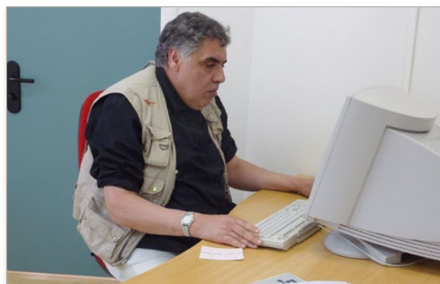
Le dispositif « H 24 » propose notamment un soutien dans la recherche d'emploi