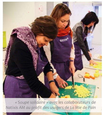
« Soupe solidaire » avec les collaborateurs de Natixis AM au profit des usagers de La Mie de Pain

Ces différents soutiens permettent à de nombreux collaborateurs de se mobiliser au profit de La Mie de Pain et de répondre à différents besoins de l'association ; une relation durable s'est créée au-delà de Natixis AM puisque d'autres entités de Natixis ont également souhaité mettre en place des actions avec La Mie de Pain.